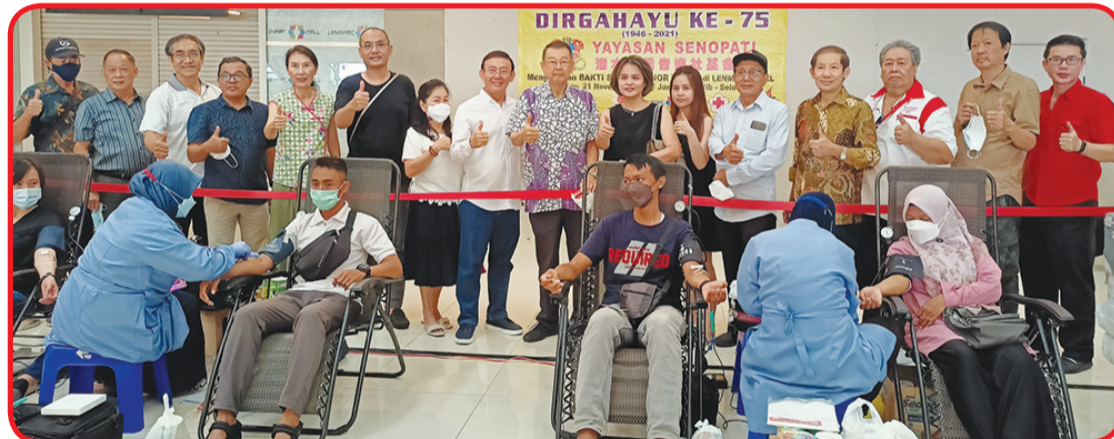
Donatur bersama pendonor.