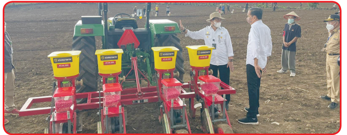
Presiden Joko Widodo dan Menteri Pertanian Syahrul Yasin Limpo saat mau menjalankan traktor yang akan mendukung aktivitas petani setempat.

JAKARTA (IM) - Presiden Joko Widodo (Jokowi) telah meresmikan Bendungan Karalloe di Gowa, Sulawesi Selatan (Sulsel), pada Selasa (23/11) lalu. Pimpinan Makassar Strait Marine Center (MSMC) menyambut gembira atas peresmian bendungan tersebut.