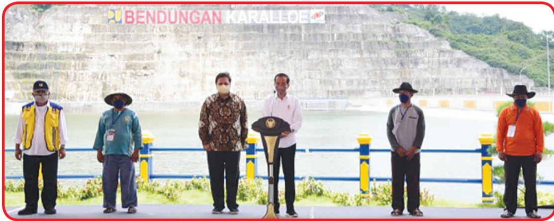
Presiden Joko Widodo saat meresmikan Bendungan Karalloe didampingi Menko Perekonomian Airlangga Hartarto, Menteri Pekerjaan Umum dan Perumahan Rakyat Basuki Hadimuljono, Plt. Gubernur Sulawesi Selatan Andi Sudirman Sulaiman dan pejabat lainnya.