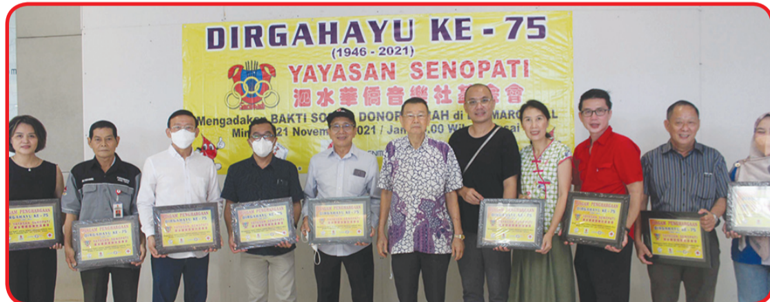
Penghargaan kepada para donatur.